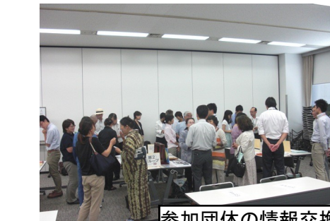
参加団体の情報交換会

【行動欲求】・・・行ってみたい！ 観てみたい！ 小旅行や訪問、展覧会や映画鑑賞、 ウインドショッピングなどのお楽しみ・・・ 【改善欲求】・・・片付けたい！不具合を直したい 住まいを快適に保ちたい・・・ 【購買意欲】・・・あんな物を買いたいけど・・・お店に見に行けない 使い方がわからないので、どう選んでいいやら