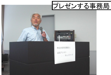
プレゼンする事務局